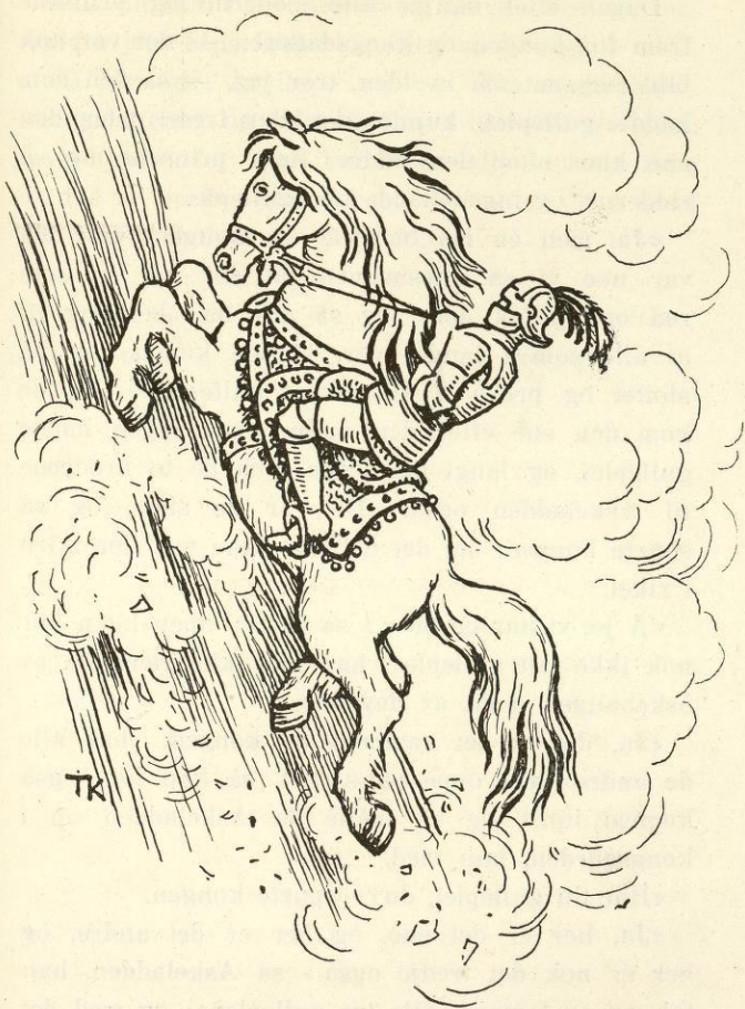
Han føk opefter som en fjær i et vindkast.